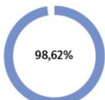
Taxa de execução